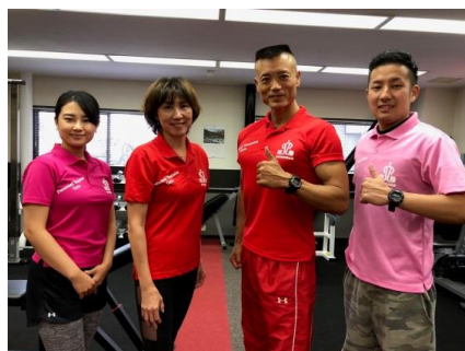
枝光社長と 高槻店トレーナー